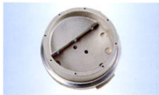
“MG”型計量裝置，用於計量流動性好的顆粒狀或粉狀添加劑