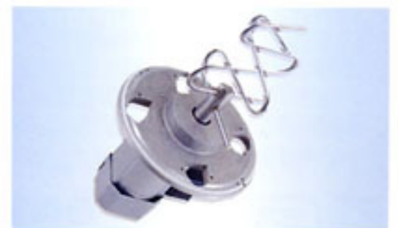
攪拌馬達和不銹鋼攪拌臂