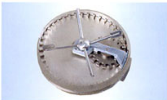
“MP”型計量裝置，用於計量非流動性粉狀添加劑